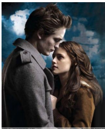
Bella a Edward

Úplně vpravo na fotografii je hlavní postava a také miláček dívek, které tyto knihy kdy četly. Tato knížka je hlavně pro dívky, kterým chybí láska a které se chtějí na malou chvíli zasnít.