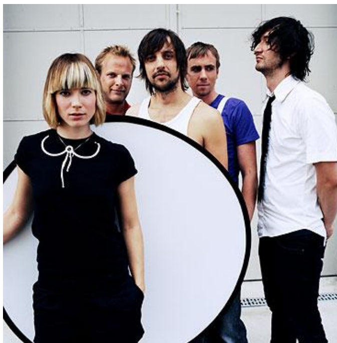
Obr. 5 MIA.