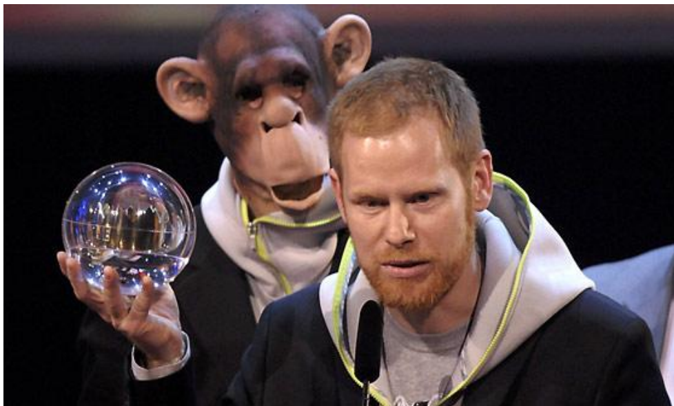
Obr. 4 Peter Fox

Peter Fox patří (s nadsázkou) ke starším představitelům. Narodil se 3. září 1971. Od roku 1998 je zpěvákem skupiny Seed, v posledních letech vydal i dvě sólová alba. Jeho typickým znamením je maska opice, ve které se nechal vyfotit na obaly svých alb a také v ní on nebo členové jeho kapely často vystupují ve videoklipech. Jeho hudba je rytmická, nedá se označit jako klasický pop, občas se prolíná s hip hopem. Zvláště videoklipy k jeho písním jsou skutečně nápadité. Za poslech stojí skladby Haus am See a Alles neu , obě z alba Stadtaffe z roku 2008.