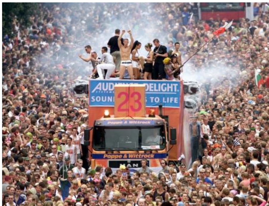
Obr. 1 Love Parade