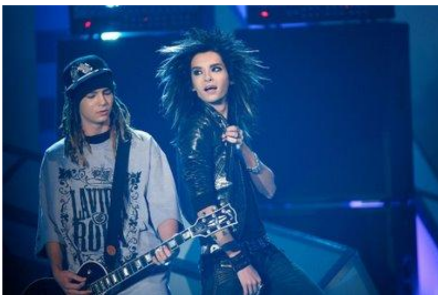
Obr. 16 Tom a Bill na koncertě Zimmer 483 Tour

Nová deska samozřejmě znamená také nové turné. Zimmer 483 Tour se konalo na jaře a v létě 2007. První koncert se odehrál v Praze, druhá a poslední česká zastávka byla v Ostravě. Koncerty svou úspěšností překonaly ty předchozí. Většina hal byla vyprodaná, téměř na každém koncertě bylo minimálně 10 000 lidí. Byly propracované, hrálo se na pódii se speciálním designem, na klucích byly znát větší zkušenosti a viditelně si po opadnutí nervozity užívali kontakt s publikem. Záznam koncertu v západoněmeckém Oberhausenu byl vydán už na druhém DVD (první Leb die Sekunde dokumentovalo koncert předchozího turné ve stejném městě). K DVD Zimmer 483: Live in Europe natočili všudypřítomní kameramani přílohu The Documentary , která nás provází cestami po turné a zážitky kluků z Tokio Hotel a zároveň se o nich můžeme dozvědět mnoho nového a zajímavého.