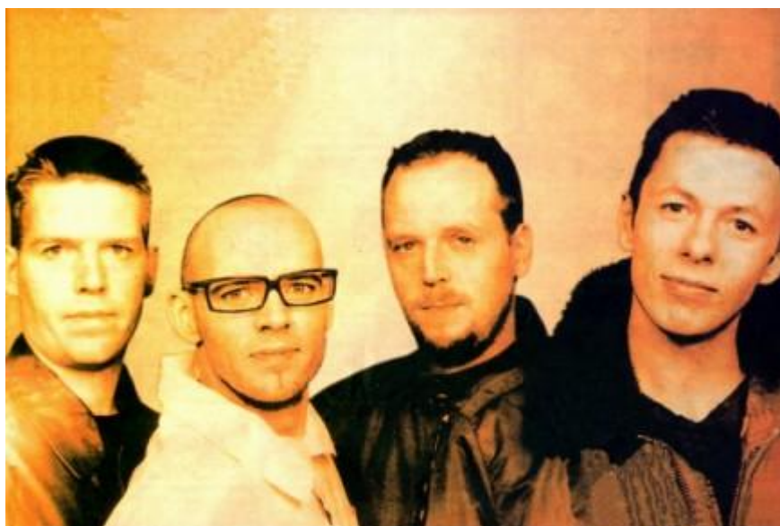
Obr. 9 Die fantastischen Vier

Diskografie Fanta 4 čítá rekordních 17 alb, největší úspěch mělo v roce 2001 vydané Unplugged , což je záznam z koncertu hudební televize MTV.