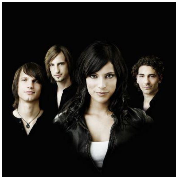
Obr. 6 Silbermond