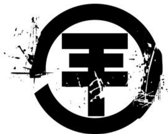
Obr. 13 Znak skupiny Tokio Hotel

Po necelých dvou letech byla deska připravena k vydání. Za velkou prodejnost vděčí kapela i teenagerskému časopisu Bravo, který z ní udělal fenomén ještě před vydáním debutového alba. Jako ochutnávka vyšel napřed singl Durch den Monsun (ve východní Asii byla vydána jeho japonská modifikace). Bylo to 15. srpna 2005 a od tohoto data se počítá celá tokiománie. Obchody se singly byly doslova v obležení fanynek. Úspěchy se valily jako lavina. Durch den Monsun se po jedenácti dnech katapultoval z nuly na první příčky hitparád v Německu i Rakousku. Postavy mladých muzikantů byly na titulních stranách spousty časopisů. Tisíce ječících fanynek doprovázely kluky na každém kroku.