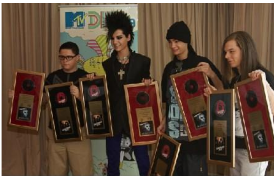
Obr. 18 Kapela s nově oceněnými alby

Na kontě mají tedy Tokio Hotel z těch významnějších ocenění několik německých cen Comet, udělovaných hudební televizí Viva, Echo a MTV Music Award v kategorii Nejlepší kapela, kde soupeřili třeba se skvělou skupinou Black Eyed Peas nebo novým americkým fenoménem Jonas Brothers. Mimo to získali množství zlatých a platinových desek a pravidelně jsou na prvních místech ve všech hitparádách.