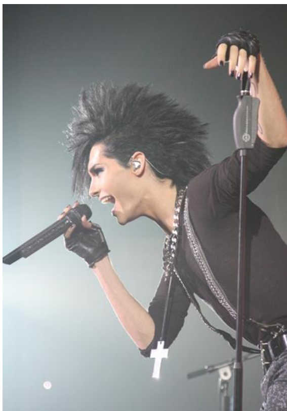
Obr. 17 Zpěvák Bill Kaulitz

Že svou vizáží vyvolává kapela Tokio Hotel mnoho protichůdných názorů, je jisté. Ať je to tak nebo tak, image je důležitá součást této kapely. Zaručuje totiž, že na ni těžko zapomenete a ona se tak nikdy neztratí mezi mořem jiných interpretů.