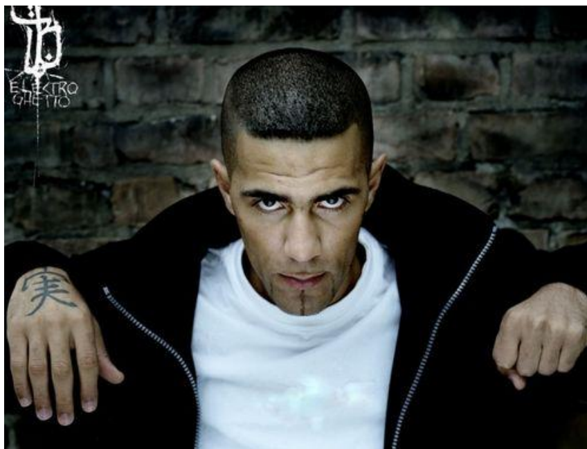
Obr. 8 Bushido