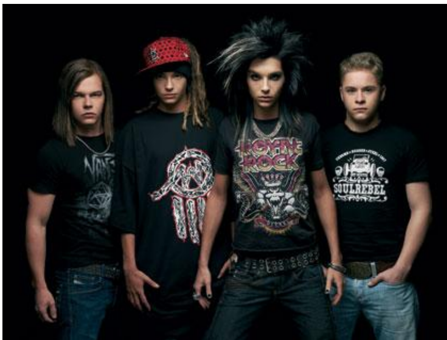
Obr. 20 Tokio Hotel