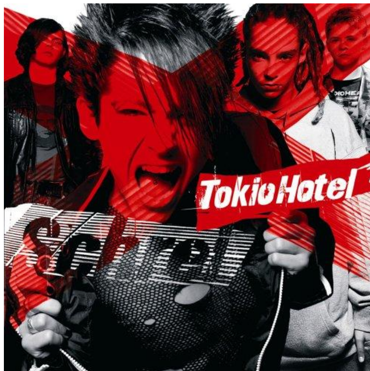
Obr. 15 Obal alba Schrei

Debutové album Schrei vyšlo 19. září 2005. Pokud si ještě někdo nebyl jistý velikostí tohoto šílenství, tato deska smetla všechny pochybnosti. Je třeba říct, že tato mánie nebyla zdaleka způsobena pouze vzhledem a charismatem členů kapely. Připomenuli-li, že v době, kdy se deska nahrávala, bylo nejmladšímu členovi 14 a nejstaršímu 16 let, tak si zaslouží minimálně uznání. Autentický zvuk prochází celým albem, písně jsou rebelské, vychází z nich syrové mládí, jsou rytmické. Některé, jako pilotní píseň Schrei nebo Gegen meinen Willen jsou tvrdší, jiné ( Rette mich , Unendlichkeit ) jsou pomalé a tajemné. Mně osobně se nejvíc líbí písně Freunde bleiben a Jung und nicht mehr jugendfrei , ze kterých přímo srší energie.