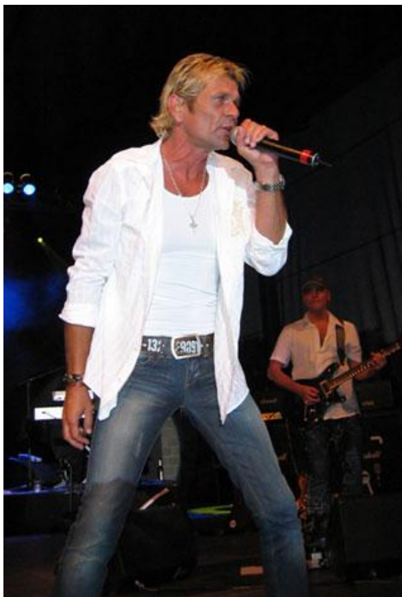
Obr. 2 Matthias Reim

v německých hitparádách. Jeho koncerty jsou v Německu stále oblíbené. Aktuální je jeho album z roku 2007 Männer sind Krieger .