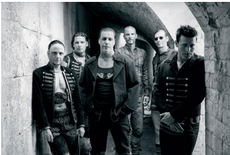
Obr. 7 Rammstein