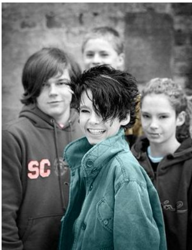
Obr. 12 Devilish

Po dvou letech spolupráce bylo na světě sedm písniček, které si žádaly být vydány na albu. CD jednoduše nazvané Devilish bylo nazpíváno zčásti anglicky, zčásti německy. Toto album se ale nepovažuje za debutové, protože nebylo nikým oficiálně vydáno ani produkováno. Kluci z Tokio Hotel písně nahrané ve studiu nevlastního táty sami vypálili v počtu 300 kusů a sami na ně vyrobili obaly.