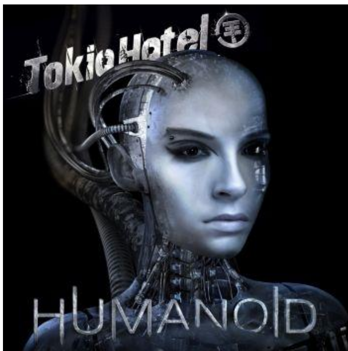
Obr. 19 Obal alba Humanoid

druhé, protože je onen humanoid na obalu desky znázorněn jako robot s lidskou tváří, vystihuje elektronický nádech hudby.