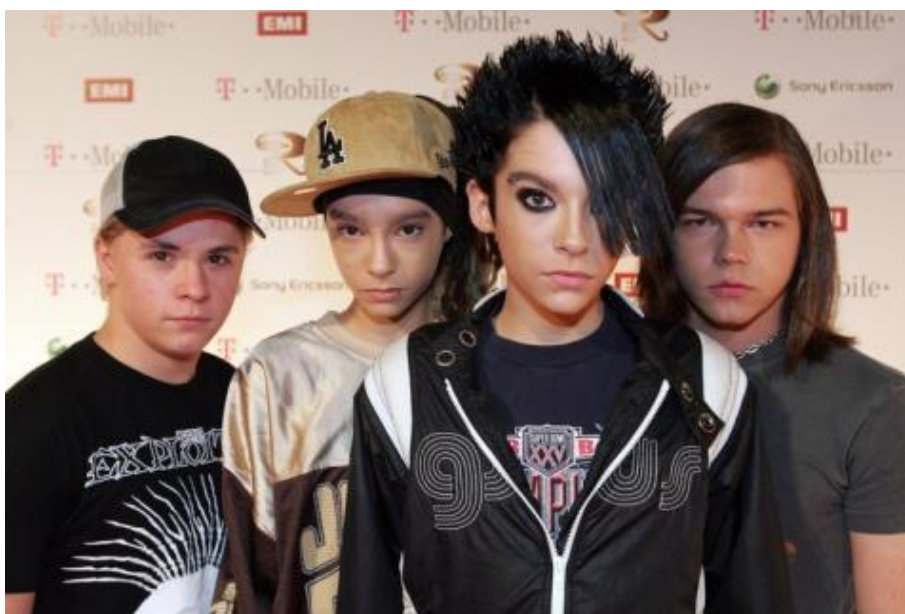
Obr. 14 Tokio Hotel (2005)

Po necelých dvou letech byla deska připravena k vydání. Za velkou prodejnost vděčí kapela i teenagerskému časopisu Bravo, který z ní udělal fenomén ještě před vydáním debutového alba. Jako ochutnávka vyšel napřed singl Durch den Monsun (ve východní Asii byla vydána jeho japonská modifikace). Bylo to 15. srpna 2005 a od tohoto data se počítá celá tokiománie. Obchody se singly byly doslova v obležení fanynek. Úspěchy se valily jako lavina. Durch den Monsun se po jedenácti dnech katapultoval z nuly na první příčky hitparád v Německu i Rakousku. Postavy mladých muzikantů byly na titulních stranách spousty časopisů. Tisíce ječících fanynek doprovázely kluky na každém kroku.